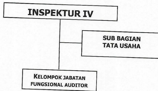
Gambar 1.1. Struktur Organisasi Inspektorat IV

Pada tahun 2023 Triwulan IV, Inspektorat IV memiliki total pegawai sebanyak 18 orang dengan rincian 1 (satu) orang Inspektur, 1 (satu) kepala subbagian tata usaha, 12 (dua belas) orang Auditor, 2 (dua) orang calon auditor, dan 2 (dua) orang fungsional umum.